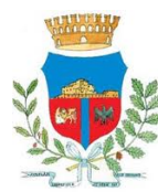
COMUNE di CALLIANO